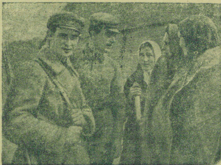
На снимке: Красноармейцы беседуют с крестьянками.

Население Западной Белоруссии радостно встречает Красную Армию.