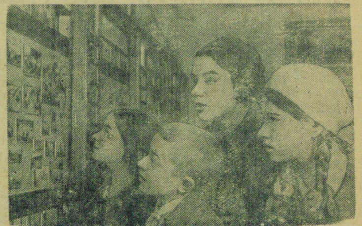
Школьные каникулы в гор. Пскове.

11. Объединить во всех обкомах, окружках, крайкомах, ЦК ЛКСМ союзных республик и в ЦК ВЛКСМ существующие отделы учащейся молодежи и отделы пионеров в единые отделы школьной молодежи и пионеров.