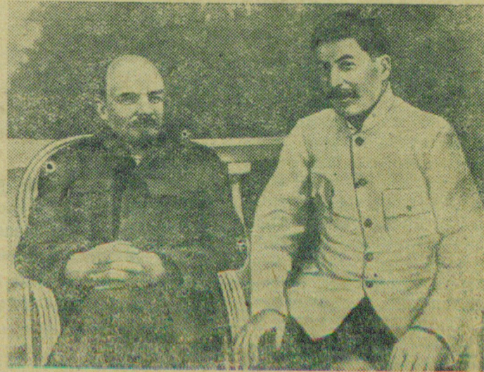
В. И. Ленин и И. В. Сталин в Горках (1922 г.)

Мы помним день, печальный день меж днями. Как слезы, с неба падал чистый снег. В большой стране, засыпанной снегами, Скончался самый мудрый человек. В степях широких бушевала вьюга, Росли сугробы, и трещал мороз. В Москве, Прощаясь с гением и другом, Великий Сталин клятву произнес. И видим мы, свидетели живые, Что эта клятва верная жива. И стали делом мудрые, простые, Вошедшие в историю, слова. ДЖАМБУЛ. (Песня о клятве).