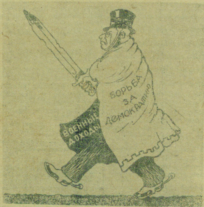
„Демократический“ плащ и его подкладка.