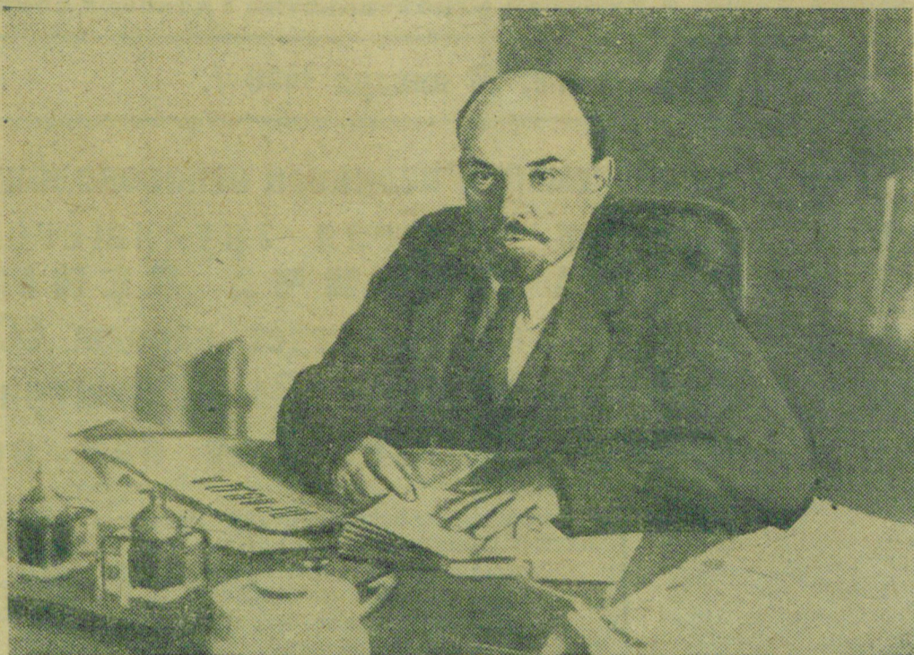
В. И. Ленин. (1918 г.).

Товарищи, мы, коммунисты,—люди особого склада. Мы скроены из особого материала. Мы—те, которые составляем армию великого пролетарского стратега, армию товарища Ленина. Нет ничего выше, как честь принадлежать к этой армии. Нет ничего выше, как звание члена партии, основателем и руководителем которой является товарищ Ленин. Не всякому дано быть членом такой партии. Не всякому дано выдержать невзгоды и бури, связанные с членством в такой партии. Сыны рабочего класса, сыны нужды и борьбы, сыны невероятных лишений и героических усилий—вот кто, прежде всего, должны быть членами такой партии. Вот почему партия ленинцев, партия коммунистов, называется вместе с тем партией рабочего класса.