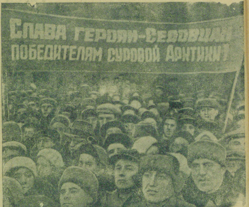
На снимке: Трудящиеся Ленинграда приветствуют героический экипаж ледокола „Г. Седов“.