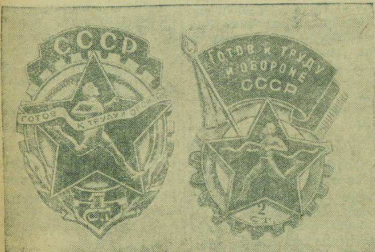
Решением Совета Народных Комиссаров СССР с 1 января 1940 г. установлены новые нормы комплекса «Готов к труду и обороне СССР».