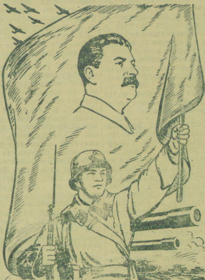
ИМЯ СТАЛИНА—ПОБЕДНОЕ ЗНАМЯ ДОБЛЕСТНОЙ КРАСНОЙ АРМИИ

Лейтенант вдавил тело в сугроб так, что на поверхности оставался лишь кусок каски. Он почувствовал резкий ожог в шее, затем в плечо и надрыв мышцы,