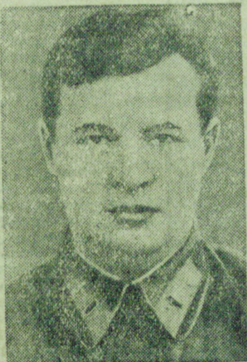
На снимке: Герой Советского Союза капитан Н. Г. Саранчев. (Фотоклише ТАСС).