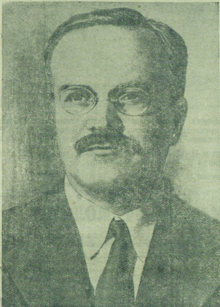
В. М. МОЛОТОВ.

Весной 1915 г. был подготовлен созыв Московской общегородской конферен-