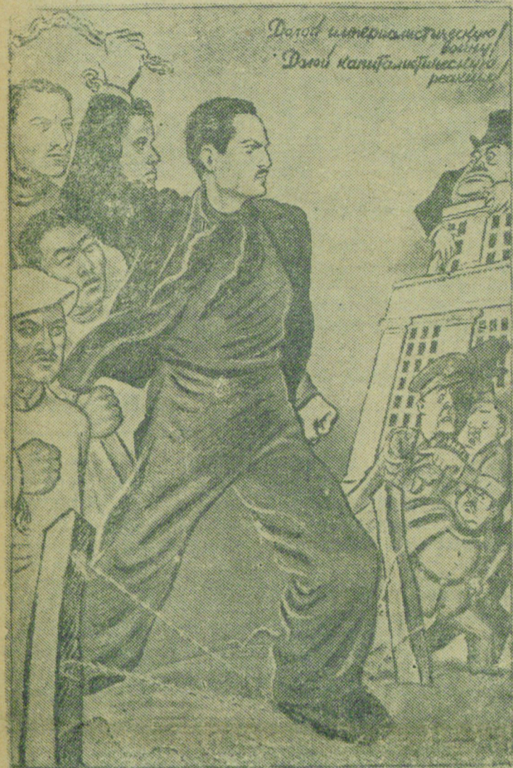
На снимке: Плакат работы художника Бор. Ефимова, выпущенный издательством „Искусство“ ко дню МОПР'а.

Репродукция Г. Широкова (Фотоклише ТАСС).