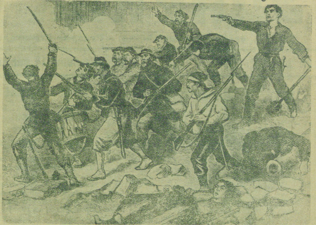
На снимке: в последний бой (1871 г.)