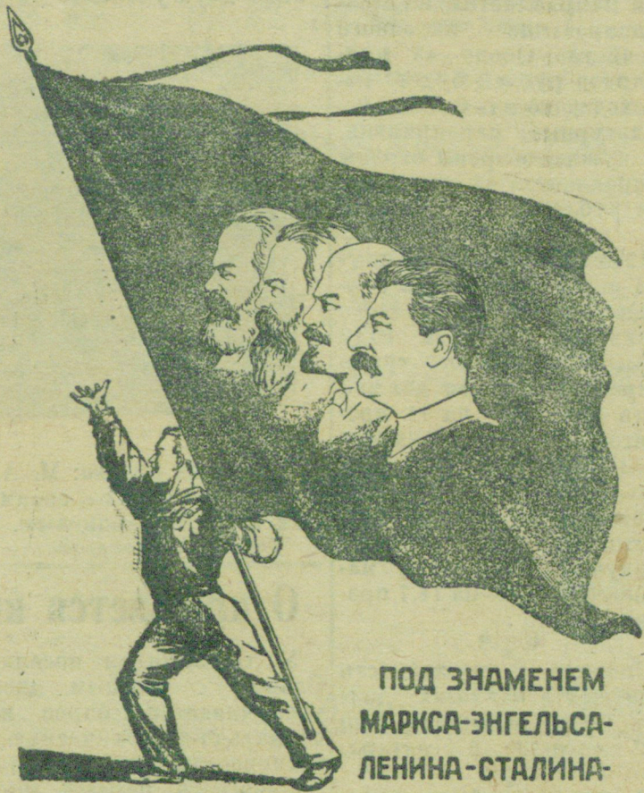
ПОД ЗНАМЕНОМ МАРКСА-ЭНГЕЛЬСА- ЛЕНИНА-СТАЛИНА- ВПЕРЕД, К ПОБЕДЕ КОММУНИЗМА!

В основе всех побед страны социализма лежит свободный творческий труд миллионов. Советский народ, руководимый партией Ленина-Сталина, обогатил землю, создал новые города и новые промышленные районы, построил тысячи фабрик, заводов, шахт, электростанций вооруженных по последнему слову техники. Он построил шесть с половиной тысяч машинно-тракторных станций и пять тысяч совхозов. Его руками возвращаются к жизни мертвые пустыни, соединяются моря, свершаются великие научные открытия. Работая во имя общего блага, советский