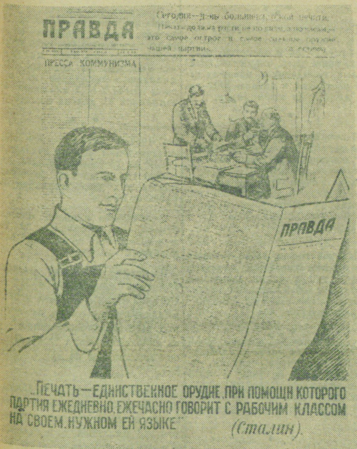
Печать—единственное орудие, при помощи которого партия ежедневно, ежечасно говорит с рабочим классом на своем, нужном ей языке (Сталин)

Печать—единственное орудие, при помощи которого партия ежедневно, ежечасно говорит с рабочим классом на своем, нужном ей языке (СТАЛИН)