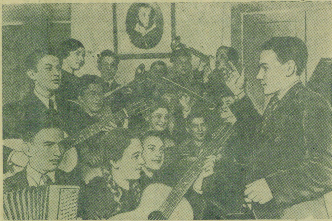
Ученики 4-й средней школы г. Новгорода (Лен. обл.) деятельно готовятся областному смотру детской художественной самодеятельности. Шумовой оркестр, созданный учениками, пользуется большой популярностью в городе. На снимке: Шумовой оркестр учеников 4-й средней школы.