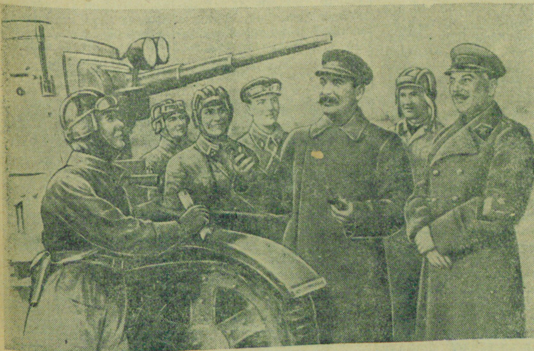
На снимке: „Товарищи И. В. Сталин и К. Е. Ворошилов среди танкистов“. Репродукция с плаката работы художника А. Г. Кручины, выпущенного Военздатом Наркомата Обороны Союза ССР. (Фотохроника ТАСС). Репродукция Г. Широкова.