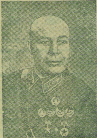
Народный Комиссар Обороны СССР Маршал Советского Союза С. К. ТИМОШЕНКО.