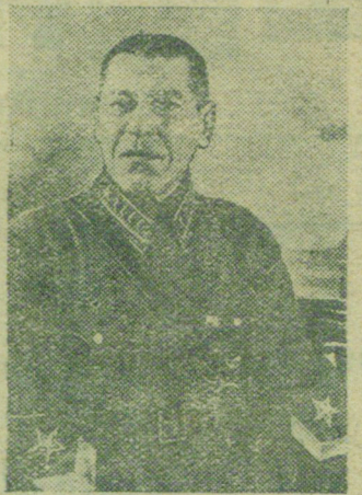
Маршал Советского Союза Б. М. ШАПОШНИКОВ.