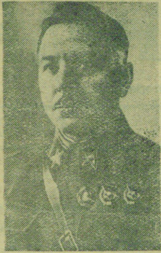
Заместитель председателя Совнаркома СССР и Председатель Комитета Обороны при СНК СССР Маршал Советского Союза К. Е. ВОРОШИЛОВ. Фотоклише ТАСС.