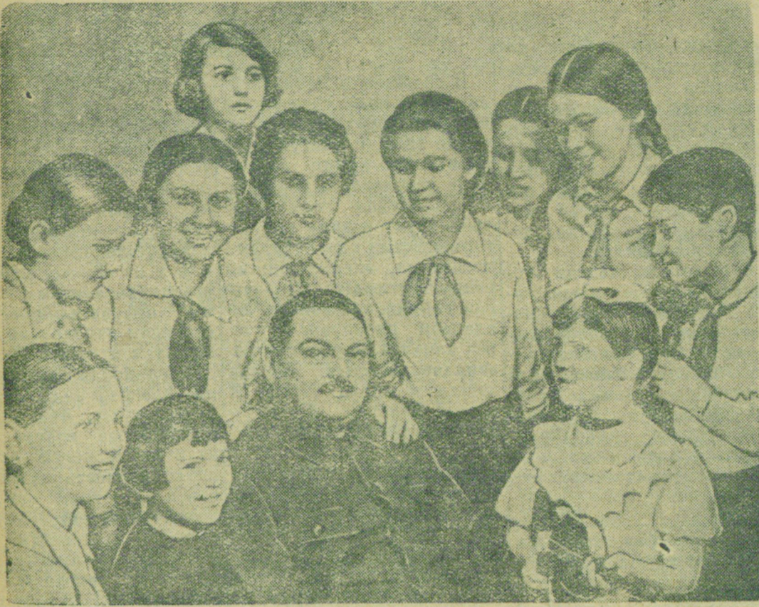
6 мая в Ленинградской Государственной Филармонии состоялся концерт детского художественного творчества.