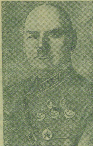
Маршал Советского Союза Г. И. КУЛИК.