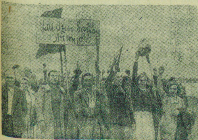
На снимке: Демонстрация трудящихся города Риги (Латвия) приветствует части Красной Армии. (На плакате надпись: „Да здравствует Красная Армия“).