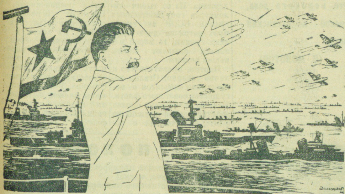
Рисунок художника Н. А. Долгорукова.

Да здравствует партия Ленина-Сталина—вождь и организатор Военно-Морского Флота СССР!