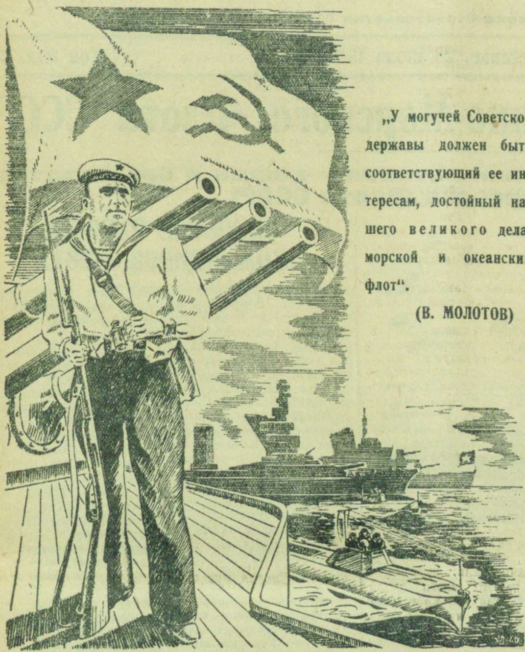
Рисунок художника К. Н. Лебедева.

„У могучей Советской державы должен быть соответствующий ее интересам, достойный нашего великого дела, морской и океанский флот“.