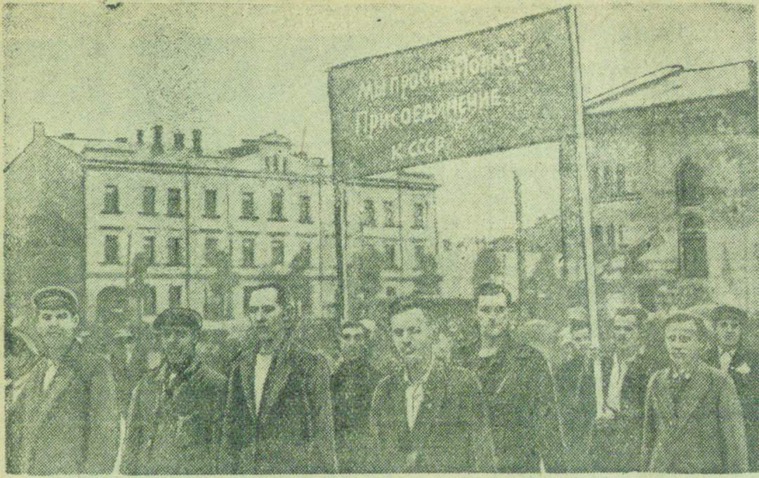
На снимке: Демонстрация трудящихся города Либавы (Латвия) с требованием о присоединении к Советскому Союзу.