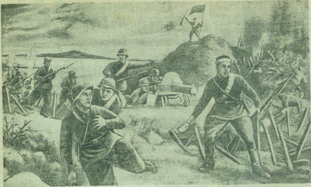
На снимке: „Героическая гибель комиссара Пожарского“. (Бои в районе озера Хасан). Картина курсанта военно-политического училища им. Энгельса тов. Приписова.