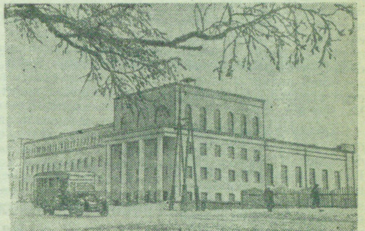
На снимке; Здание Хабаровского педагогиче-ского института.