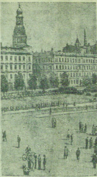
На снимке: Одна из улиц гор. Риги.