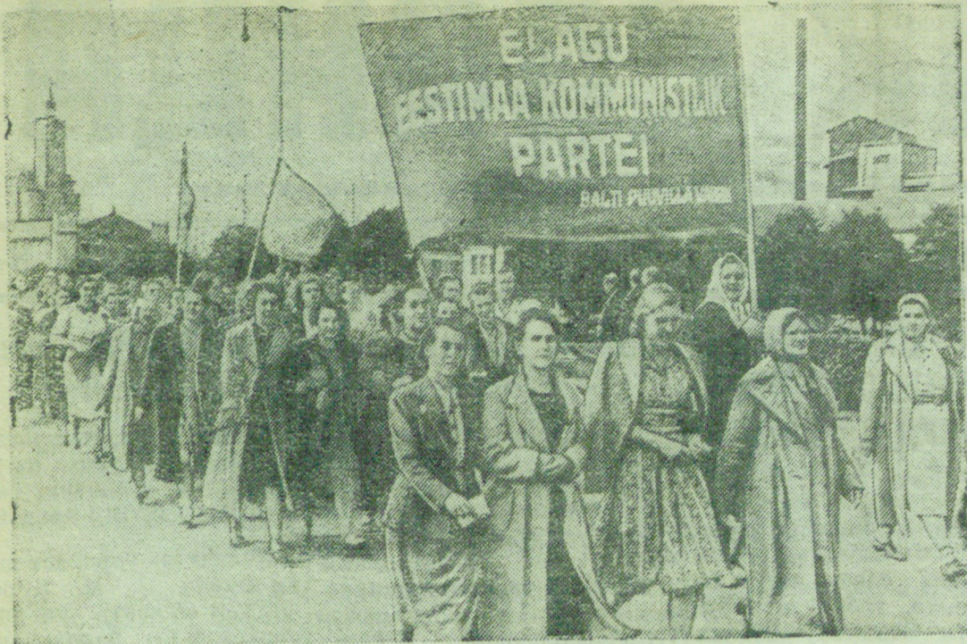
Трудящиеся Советской Эстонии с радостью встретили решение VII Сессии Верховного Совета СССР о принятии Эстонии в Советский Союз. На снимке: Демонстрация трудящихся города Таллина.