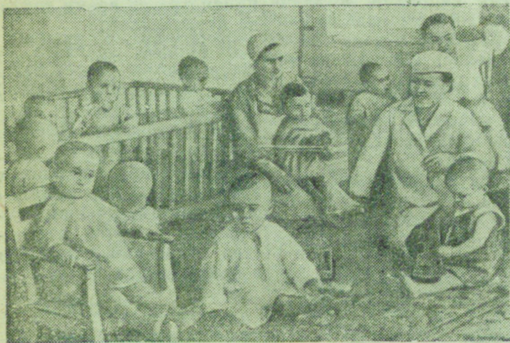
В доме грудного ребенка в Кишиневе.

В городах и селах Бессарабии открывается широкая сеть детских учреждений (яслей, консультаций, садов и т. д.).