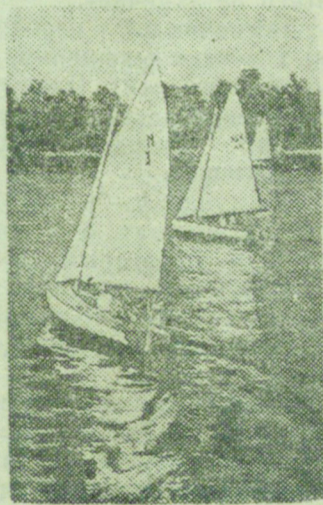
На снимке: Яхты на Неве (Ленинград).

Начал свою деятельность реорганизованный профсоюз служащих телеграфа, почты и телефона. Образованы 13 рабочих комитетов. Профсоюз развернул большую организационную и культурную работу. Пополняется новыми книгами профсоюзная библиотека, при клубе открыта читальня, систематически проводятся лекции.