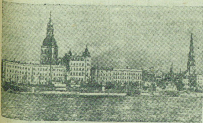
Набережная 11 ноября в г. Риге.