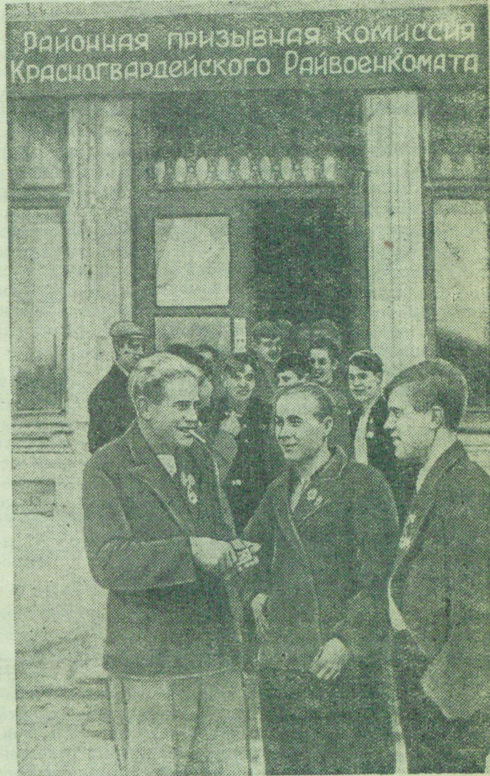
На призывном пункте в гор. Красногвардейске (Ленинградская область).