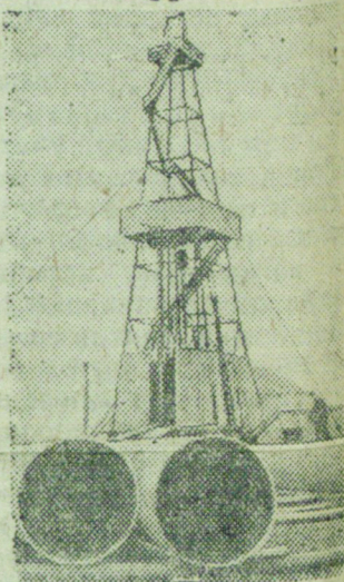
В Подмосковном угольном бассейне в 1940 г. впервые начато скоростное строительство шахт методом бурения стволов.

На снимке: Общий вид буровой вышки. На переднем плане обсадные трубы.