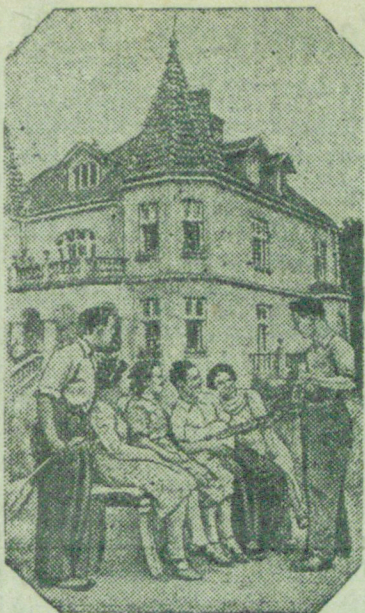
В живописной местности недалеко от города Львова расположен новый советский курорт Брюховичи. Раньше здесь были отдельные дачи польских капиталистов, теперь здесь отдыхают трудящиеся.