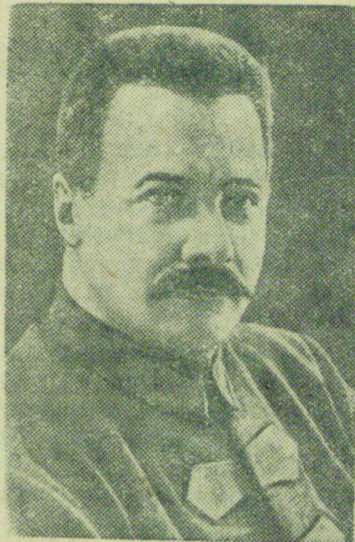
Михаил Васильевич ФРУНЗЕ

В начале гражданской войны партия посылает на Восточный фронт М. В. Фрунзе. Он назначается командующим южной группой фронта. Следуя указа-