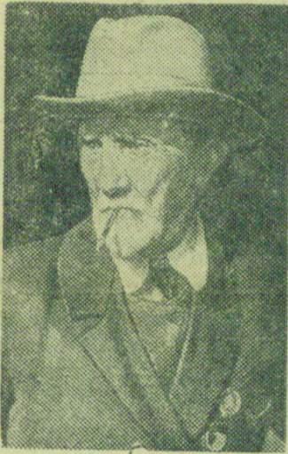
27 октября исполняется 85 лет со дня рождения Н. В. Мичурина.

На снимке: Н. В. Мичурин. Фотоклише ТАСС.