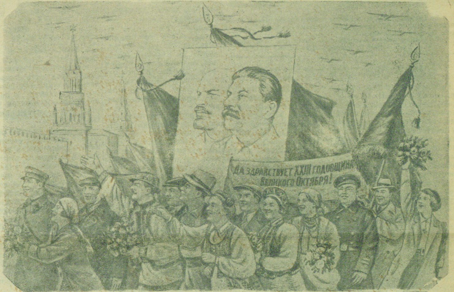
Рисунок художников Б. Баркова и В. Лисевича.

Переходящее красное знамя Наркомугля, ЦК угольщиков для шахты Кирова вручено т. Екимову. На торжественном собрании, демонстрации заявите об этом коллективу рабочих шахты. В связи с задержкой доставки, знамя шахте будет вручено после праздников. ХРЮКАЛОВ, ЕКИМОВ.