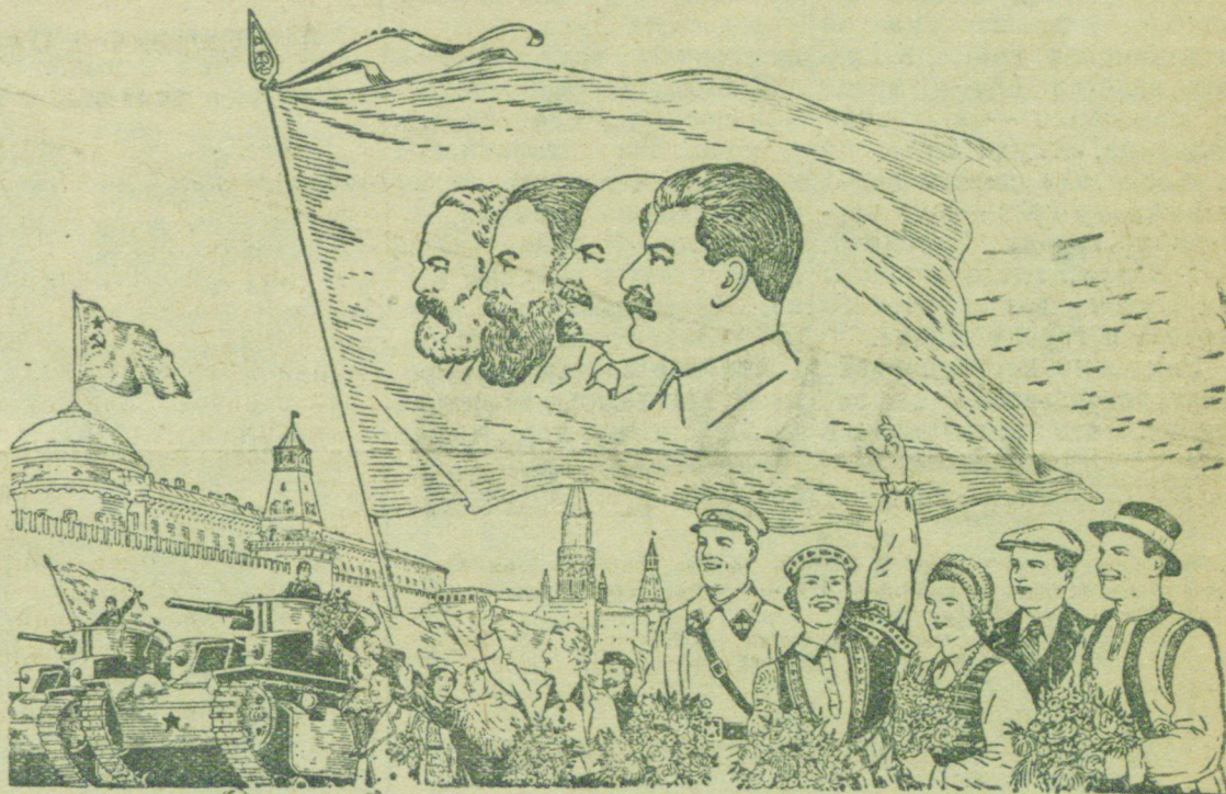
Рисунок В. Баркова и В. Лисевича.

Самая высокая выработка по шахте № 1 оказалась у проходчиков тт. Радченко и Волкова которые месячный план проходки штреков выполнили на 235 процентов и заработали каждый по 1068 рублей, чем завоевали первое место по производительности труда на шахте № 1. Лизько.