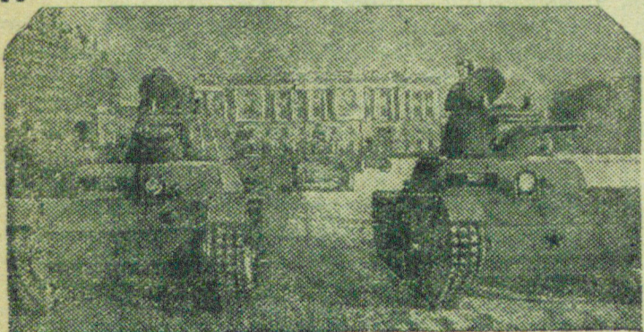
Празднование XXIII годовщины Великой Октябрьской социалистической революции в Ленинграде. На снимке: Танки на параде.