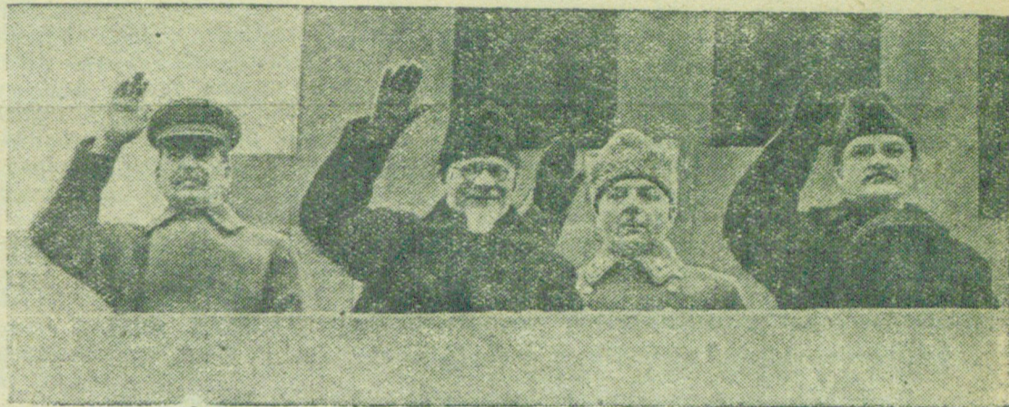
Слева направо товарищи: И. В. Сталин, М. И. Калинин, К. Е. Ворошилов, В. М. Молотов на трибуне мавзолея.