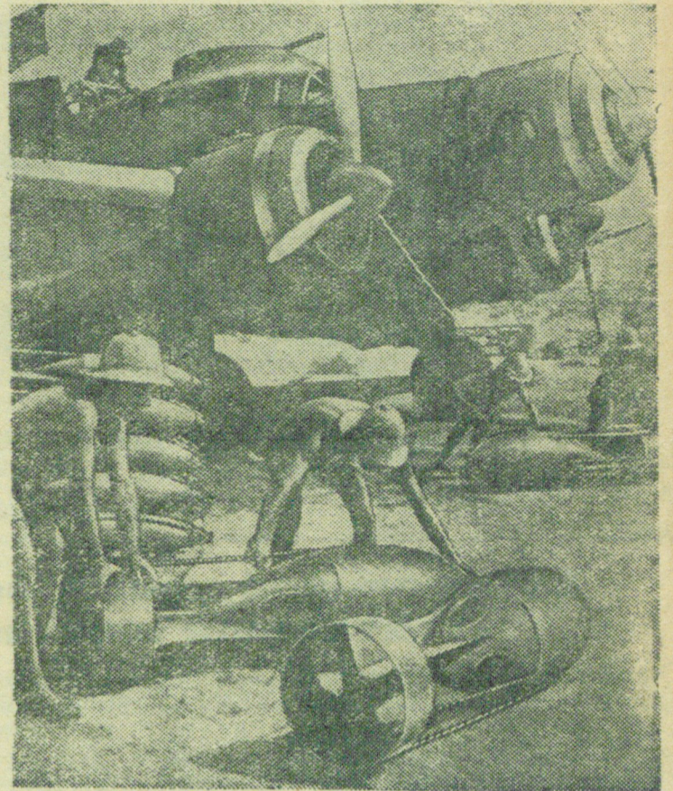
На снимке: погрузка бомб в самолет на аэродроме в одной из итальянских колоний.

Репродукция „В. И. ЦУ“ (Фотоклише ТАСС).