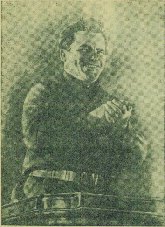
Выступление С. М. Кирова на 17 парт'езде.

«Успехи действительно у нас громадны. Черт его знает, если по-человечески сказать, так хочется жить и жить. На самом деле, посмотрите, что делается. Это же факт!»