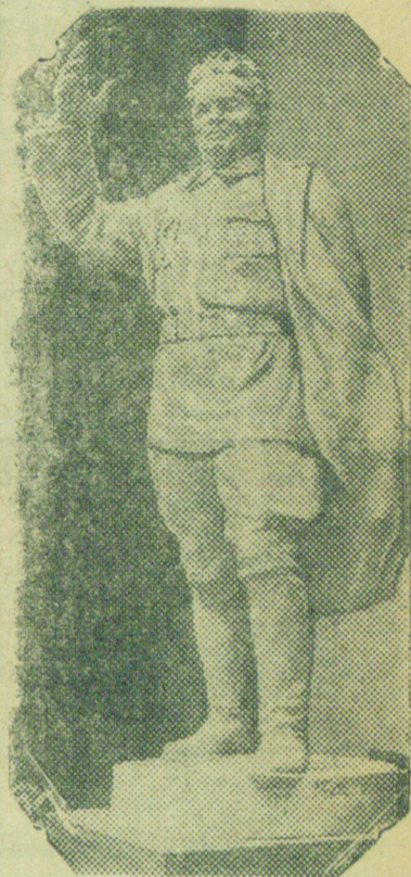
С. М. Киров. Скульптура Э. Т. Виленского.