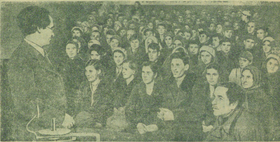
В клубе колхоза „Урожай“, Новгородского района, открылся первый в Ленинградской области колхозный лекторий.