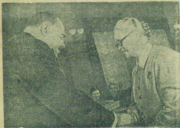
26 декабря Председатель Президиума Верховного Совета РСФСР тов. А. Е. Бадаев вручил почетные грамоты заслуженным учителям, народным и заслуженным артистам и заслуженным деятелям науки и техники.