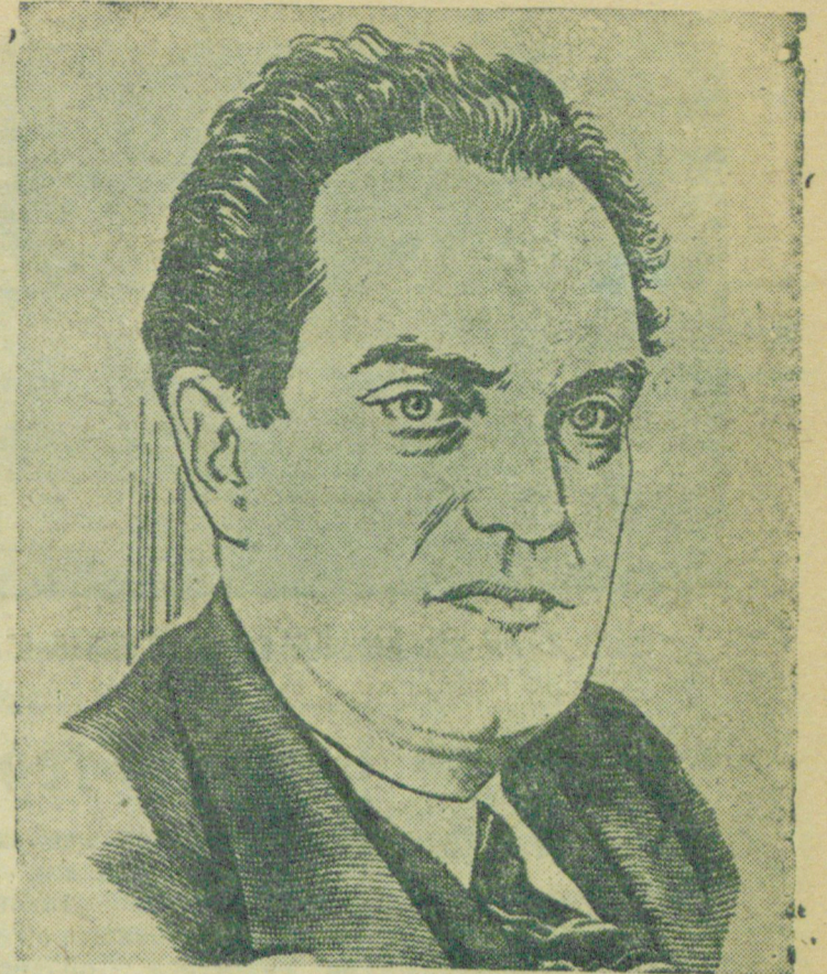
25 января исполняется шесть лет со дня смерти верного соратника Ленина и Сталина В. В. Куйбышева, злодейски умерщвленного право-троцкистской контрреволюционной бандой.