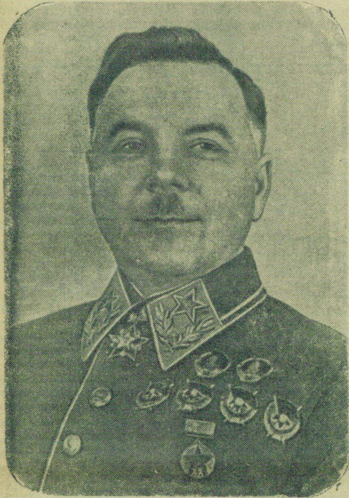
Заместитель Председателя Совнаркома СССР, Председатель Комитета Оборона при Совнаркоме СССР Маршал Советского Союза К. Е. Ворошилов.

СЕГОДНЯ ШЕСТИДЕСЯТИЛЕТИЕ СО ДНЯ РОЖДЕНИЯ КЛИМЕНТА ЕФРЕМОВИЧА ВОРОШИЛОВА