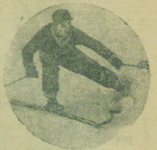
Спуск «плугом». (Фото-этуд).