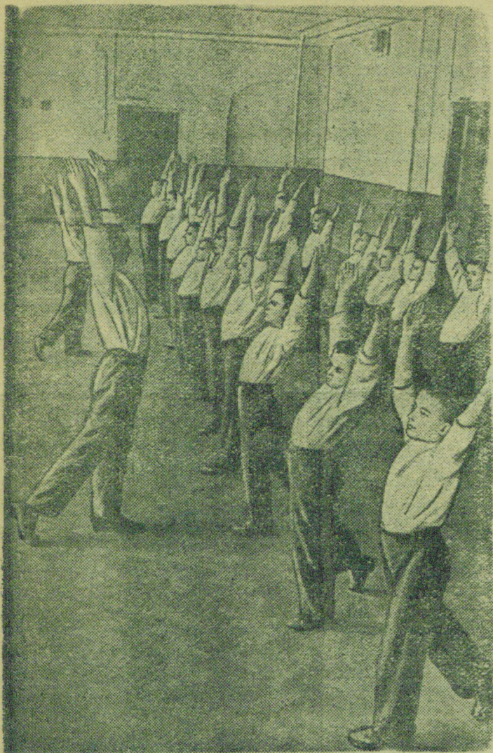
В ремесленном училище металлистов № 69 (Ленинград). На снимке: утренняя зарядка. Фото В. Васютинского (Фотохроника ТАСС).