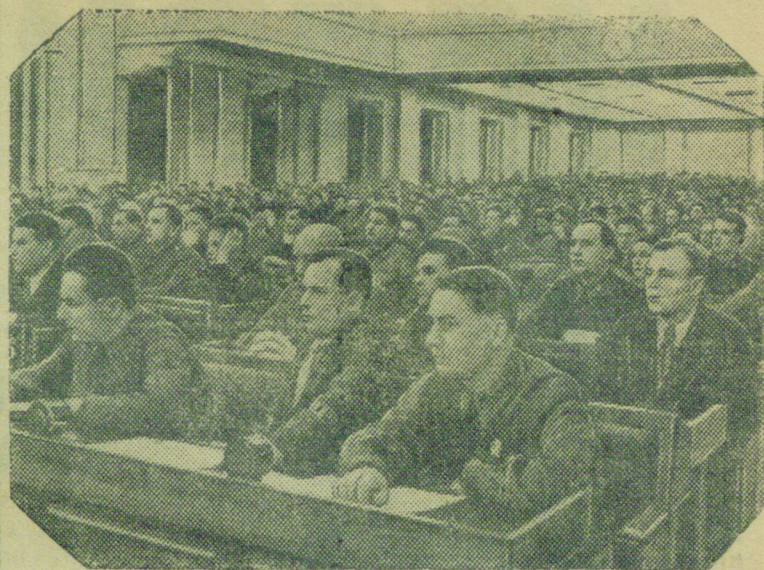
XVIII Всесоюзная конференция ВКП(б) На снимке: В зале заседания конференции.