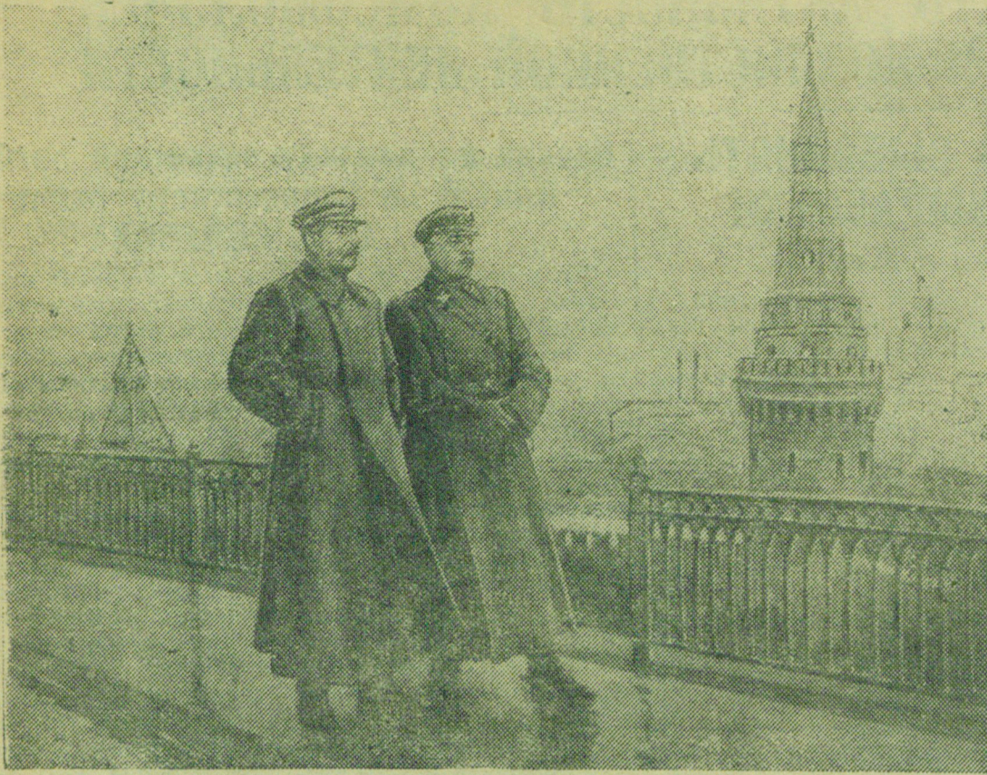
Товарищи И. В. СТАЛИН и К. Е. ВОРОШИЛОВ.