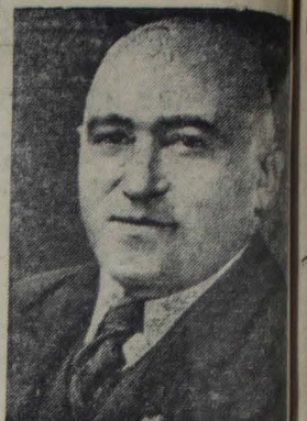
Матиас Ракоши — Генеральный секретарь Венгерской партии трудящихся.