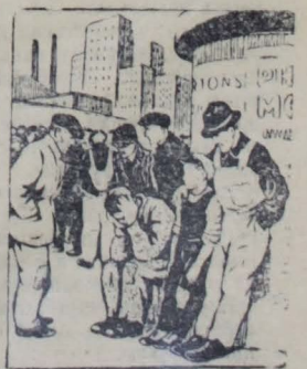
В капиталистических странах. Пресеклине ТАСС.