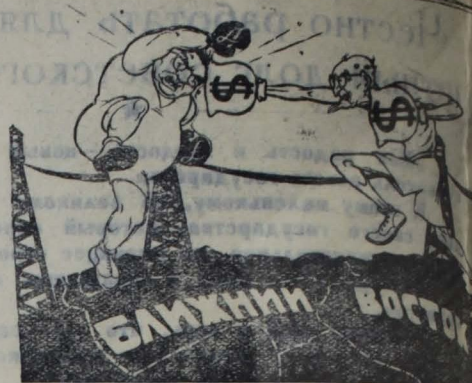
Любовь к Ближнему... Востоку.

Эта бригада уже сдала ранней зелени 200 килограммов.