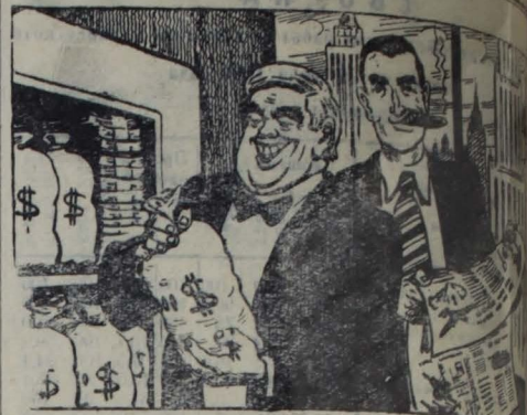
Война на руку американским империалистам Преследуют

В местных демократических кругах отмечают произвол полиции в связи с так называемыми «розысками». Подлинные шпикеры останавливают и грубо допрашивают людей, похожих на руководителей коммунистической партии Японии.