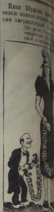
Шуман: «Дядя Сам ты что, кроме расстрелов еще ничего»

Корреспондент агентства Юнайтед пресс передает из Токио, что в коммюнике Макатура, опубликованном 27 июля рано утром, отмечается, что северокорейские войска продолжали продвижение в юго-западной Корее. Одна северокорейская воинская часть достигла дороги Чоньчжу (Дзеню) — Хамьян (Капйо), а другая часть продвинулась к пункту, расположенному приблизительно в 10 милях юго-восточнее Суньчхоня (Дзюнтен), на дороге, ведущей к Йосу (Рейсей).