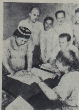
Таджикская ССР. Ученые Таджикского Филиала Академии наук СССР с большим воодушевлением поставили свои подписи под Стокгольмским Воззванием Постоянного Комитета Всемирного конгресса сторонников мира.

ХАБАРОВСК. Пять сельскохозяйственных артелей района имени Лазо строят межколхозную гидроэлектростанцию на реке Кия. Ежедневно на строительную площадку выходят жители окрестных сел. К осени станция будет готова, и колхозники получат электроэнергию для освещения домов и культурно-бытовых учреждений.