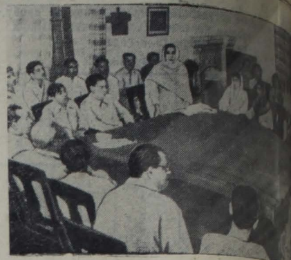
Пакистан. В городе Лахоре развернулось движение молодежи за участие тысяч людей — представителей гольфским Возвращением Постоянного Комитета Всемирных сторонников мира.

В письме указывается, что солдаты во время учений выступили с протестом против решения правительства.