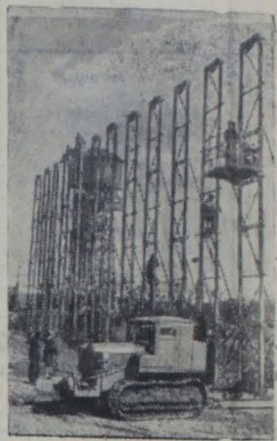
Новосибирск. Заводу строительных машин поручено изготовить для строительства Куйбышевской гидроэлектростанции партию матовых подъемников.

Панамский канал длиной 81,6 километра строился 34 года, Суэцкий — длиной в 106 километров был сооружен за 11 лет. Строительство Главного Туркменского канала общей протяженностью 1100 километров будет проведено в течение 6 лет.