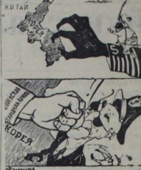
корейская поправка Рис. Н. Долгуркова. Пресеклише ТАСС