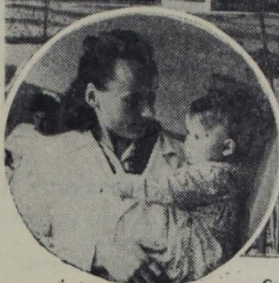
Счастлива и радостна жизнь наших детей. Партия и правительство проявляют о них неустанно отеческую заботу. В яслях и детских садах дети весело проводят время, отдыхают, хорошо питаются, пользуются вниманием и заботой.

На этом снимке, читатель, ты видишь недавно выстроенные ясли в поселке Большие Лучки. В них помещаются дети строителей и шахтеров. Ясли отлично благоустроены, здесь созданы все условия для того, чтобы молодая смена росла здоровой и крепкой.