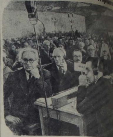
На снимке: Советская делегация на конгрессе сторонников мира