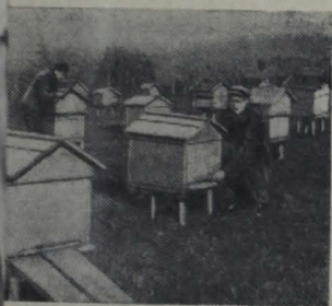
В 1947 году во всем районе не было ни

и в десять раз возросло поголовье птиц. На одну фуру молока на одну фуру составляет 893 литра.