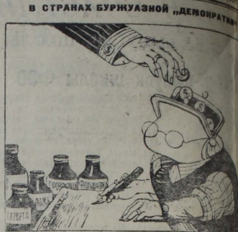
Свободная от совести «Свободная» печать. Рис. А. Гефтера

Из повести мы узнаем, что совхоз «Ясный берег» опережает время, и за два года до срока переходит в следующую пятилетку. И читатель, закрыв прочтенную книгу, не сомневается, что эти люди, воспитанные партией Ленина — Сталина в духе советского патриотизма, будут в первых рядах тех тружеников, которые построят светлое коммунистическое общество. Б. Юриков.