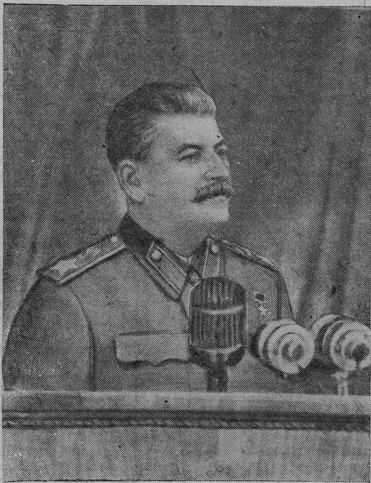
Выступление товарища И. В. Сталина на предвыборном собрании избирателей Сталинского избирательного округа г. Москвы 9 февраля 1946 года.

«Что касается планов на более длительный период, — говорил товарищ Сталин, — то пар-