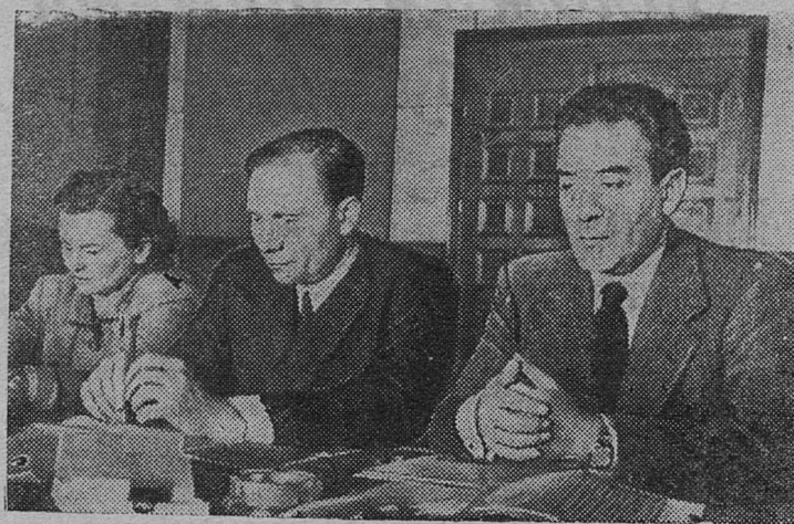
Бухарест. Сеанс Исполнительного бюро Всемирной федерации профсоюзов.

Газета указывает далее, что в послании Макартура проявлено «пренебрежение к Китаю — крупнейшей дальневосточной державе». «В дипломатических кругах вчера вечером указывали, — пишет газета, — что послание Макартура не только является пощечиной жертвам японской агрессии. Оно также полностью противоречит его же собственному заявлению. 6 месяцев тому назад он заявил, что Япония не будет перевооружена».