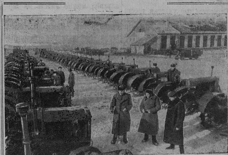
Винницкая область. Механизаторы Погребищенской МТС добиваются досрочного окончания ремонта машин тракторного парка и прицепного инвентаря.

Весной этого года решено посеять строевого леса гнездовым способом 50 гектаров. Плотность под посев подготовлена. Собраны первосортные семена сосны. В посеве леса примут участие комсомольцы Черновского сельсовета, строительного управления № 4 и другие. Райком комсомола и руководители райлесхоза в настоящее время организуют лесопосадочные бригады из состава работников леса и комсомольцев.