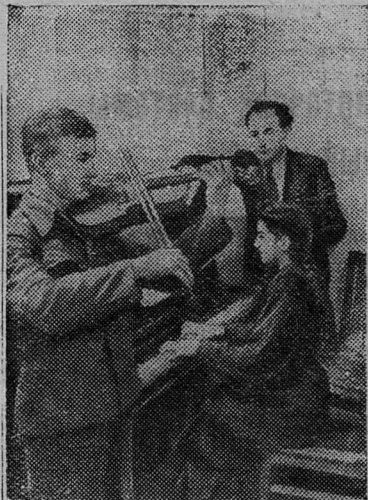
Жданов. Около 150 детей металлургов завода „Азовсталь“ обучаются в музыкальной школе при заводском Дворце культуры.