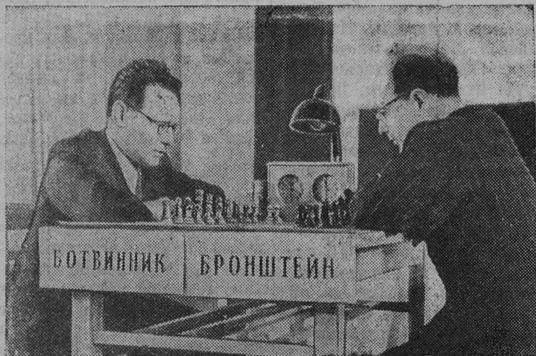
Шахматный матч на первенство мира между чемпионом мира М. Ботвинником и гроссмейстером Д. Бронштейном. На снимке: М. Ботвинник и Д. Бронштейн за очередной партией.

оснащается новыми станками: фрезерным, рейсмусным и сверлильно-долбежным. Это повышает производительность труда, позволит значительно улучшить качество выпускаемой продукции и изготавливать более сложные детали.