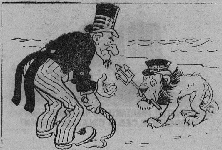
Рис. А. Баженова.