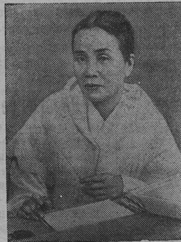
Пак Ден Ай, председатель Демократического женского союза Кореи