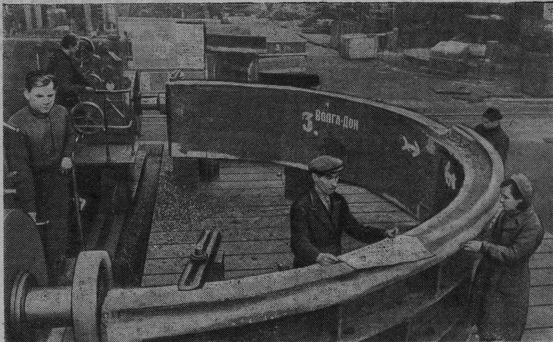
В механическом цехе завода имени Сталина. Обработка и разметка камеры рабочего колеса для турбины Цимлянской ГЭС.

— С большим воодушевлением трудится наш коллектив над почетными заказами. Строителям Волго-Донского канала отправлены разъединители различных напряжений и трансформаторы тока. Для «Куйбышевгидростроя» изготовлены и отгружены трансформаторы тока, выключатели нагрузки и разъединители. Вся продукция—высокого качества.