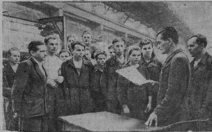
С горячим одобрением встретили трудящиеся Москвы резолюцию Советского Комитета защиты мира о сборе подписей под Обращением Всемирного Совета Мира. На митингах и собраниях трудящиеся приветствуют резолюцию. На снимке: митинг в цехе московского завода имени С. М. Кирова.

В резолюции собрания говорится, что коллектив единодушно готов подписать Обращение и подкрепить это стахановским трудом.